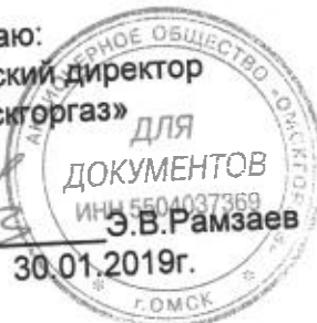
График к договору 08р/2-56 от 20.11.2013 на 2019 год

выполнения работ АО «Омскгоргаз» по ТО ВДГО плит бытовых