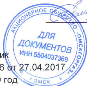
График к договору 08р/2-76 от 27.04.2017 на 2019 год