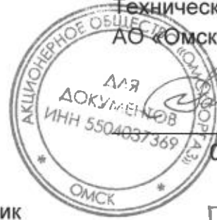
График к договору 08р/2-126 от 21.11.2013 на 2019 год выполнения работ АО «Омскоргаз» по ТО ВДГО плит бытовых