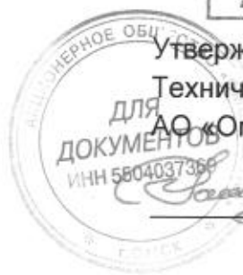
График к договору 1208р/2-2004 от 01.09.2014 на 2019 год