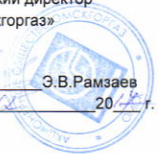
График к договору 08р/2-65 от 20.11.2013 на 2018 год выполнения работ СВС -1 АО «Омскгоргаз» по ТО ВДГО плит бытовых