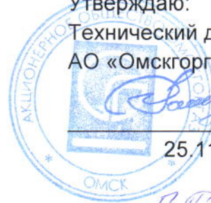
График к договору 08р/2-127 от 03.08.2017 на 2021 год