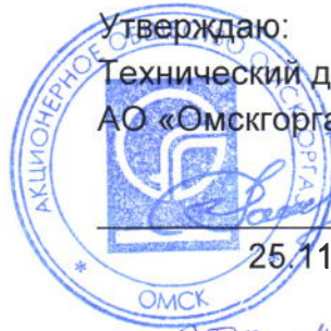
График к договору 08р/2-106 от 08.08.2019 на 2021 год