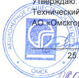
График к договору 08р/2-26 от 23.07.2020 на 2021 год