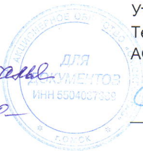
График к договору 08р/2-3 от 16.01.2014 на 2019 год выполнения работ АО «Омскгоргаз» по ТО ВДГО плит бытовых