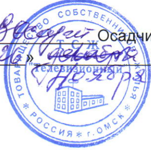
График к договору 08р/2-165 от 22.11.2013 на 2019 год выполнения работ АО «Омскгоргаз» по ТО ВДГО плит бытовых