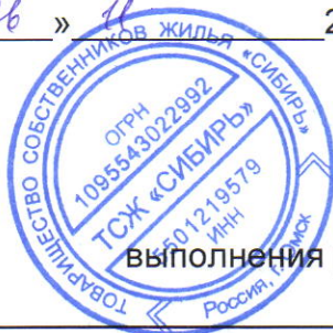
График к договору 08р/2-87 от 21.11.2013* на 2019 год

выполнения работ АО «Омскоргаз» по ТО ВДГО плит бытовых