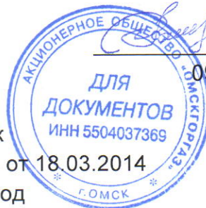
График к договору 08р/2-223 от 18.03.2014 на 2019 год

выполнения работ АО «Омскгоргаз» по ТО ВДГО плит бытовых