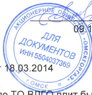
График к договору 08р/2-224 от 18.03.2014 на 2019 год выполнения работ АО «Омскгоргаз» по ТО ВДГО плит бытовых