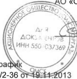
График к договору 08р/2-36 от 19.11.2013 на 2019 год выполнения работ АО «Омскоргаз» по ТО ВДГО плит бытовых