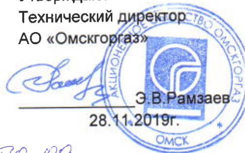
График ПТО-99 к договору 08р/2-231 от 30.12.2013 на 2020 год выполнения работ АО «Омскгоргаз» по ТО ВДГО/ВКГО тип ВКГО: Котел

Утверждаю: Технический директор АО «Омскгоргаз»