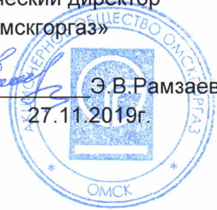
График Р70-56 к договору 08р/2-50 от 07.06.2016 на 2020 год

выполнения работ АО «Омскгоргаз» по ТО ВДГО/ВКГО тип ВКГО: Плита бытовая