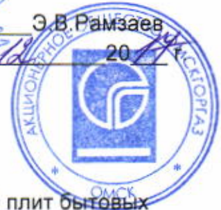
График к договору 08р/2-39 от 19.11.2013 на 2018 год выполнения работ СВС -1 АО «Омскгаз» по ТО ВДГО плит бытовых