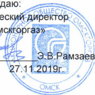
График 170-40 к договору 08р/2-121 от 21.11.2013 на 2020 год

выполнения работ АО «Омскгоргаз» по ТО ВДГО/ВКГО тип ВКГО: Плита бытовая