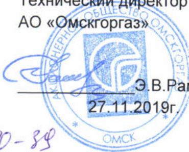
График РГО-88 к договору 08p/2-202 от 25.11.2013 на 2020 год

выполнения работ АО «Омскгоргаз» по ТО ВДГО/ВКГО тип ВКГО: Плита бытовая