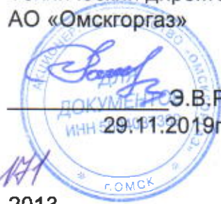
График ГРО-141 к договору 08р/2-34 от 19.11.2013 на 2020 год

выполнения работ АО «Омскгоргаз» по ТО ВДГО/ВКГО тип ВКГО: Плита бытовая