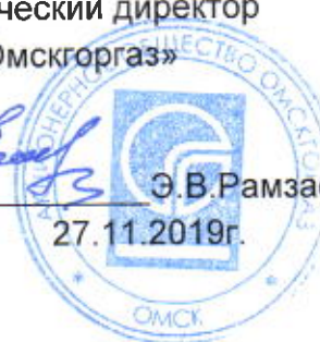
График 1790-123 к договору 08р/2-45 от 19.11.2013 на 2020 год

выполнения работ АО «Омскгоргаз» по ТО ВДГО/ВКГО тип ВКГО: Плита бытовая