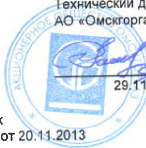
График по договору 08р/2-72 от 20.11.2013 на 2020 год