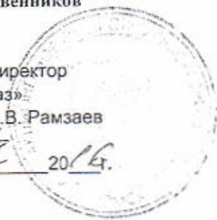
График № _____ к договору №08р/2-223 от "18" марта 2014 года на 2017 год,

выполнения работ СВС-3 АО «Омскгаз» по ТО ВДГО (ежегодное) и ПТО ВДГО (трехгодичное) на доме Южная 97