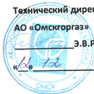
График № ПТО-968

к договору № 08р/2-168 от 24.02.2014года на 2017г.