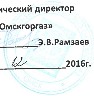
График № ПТО-891

к договору № 08р/2-19 от 06.03.2015года на 2017г.