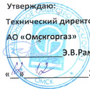
График № ПТО-883

к договору № 08р/2-29 от 21.01.2014года на 2017г.