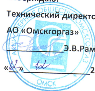
График № ПТО - 881