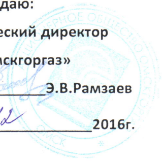
График № ПТО-877

к договору № 08р/2-149 от 04.02.2014года на 2017г.