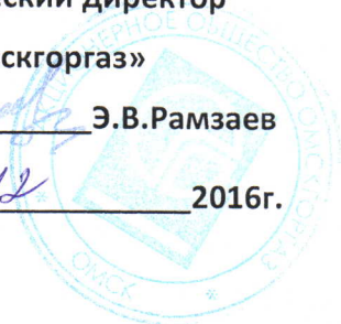
График № ГТО-176 к договору № 08р/2-195 от 10.03.2014года на 2017г.

выполнения работ СВС-2 АО «Омскгоргаз» по ТО ВДГО (ежегодное) и ПТО ВДГО (трехгодичное) на домах: