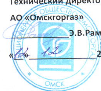
График № ПТО-847

к договору № 08р/2-10 от 17.01.2014года на 2017г.