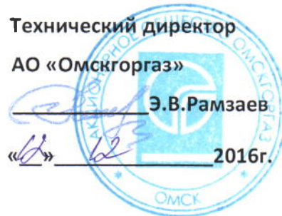
График № ПТО - 867