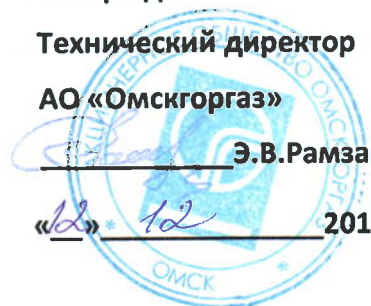
График № ПТО-870

к договору № 08р/2-256 от 15.12.13года на 2017г.