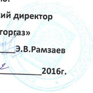
График № ПТО-845

к договору № 08р/2-117 от 31.01.2014года на 2017г.