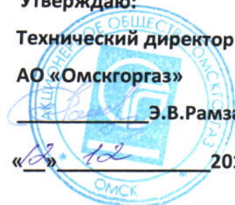
График № ПТО-839