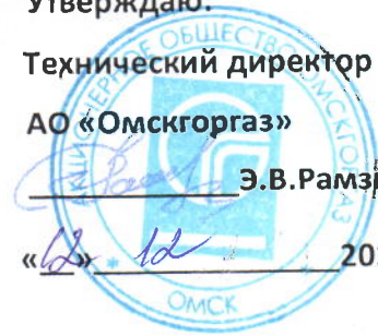
График № ПТО-843