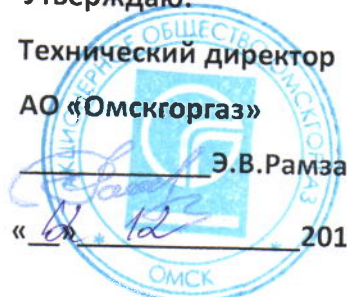
График № ПТО-850