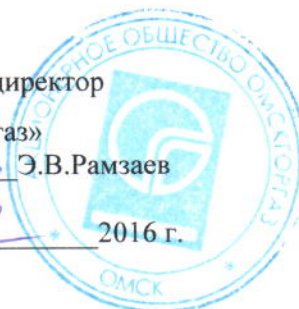
График № _____