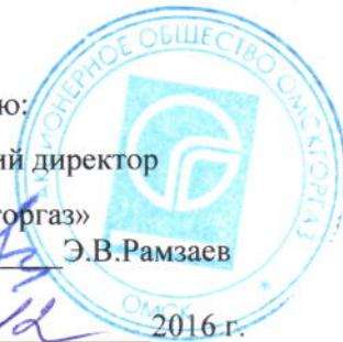
График № _____