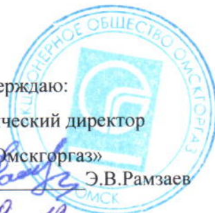
График № _____