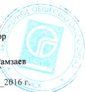
График № _____