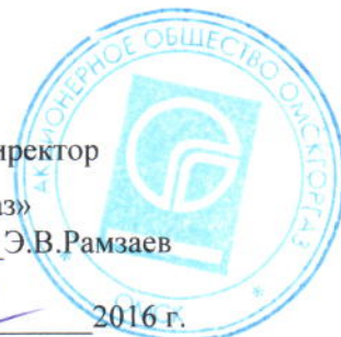
График № _____