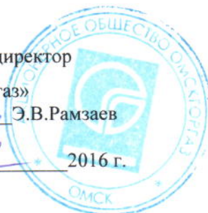
График № _____