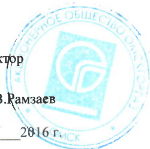
График № _____