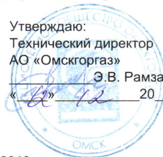
График № ГТО-681 к договору № 08р/2-186 от "25" ноября 2013 года