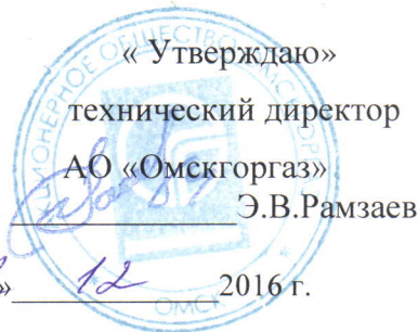
График № ГТО-488