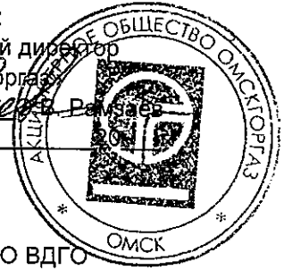
График выполнения работ СВС-3 АО «Омскоргаз» по ТО ВДГО (ежегодное) и ПТО ВДГО (трехгодичное) ООО «КТ и ИС» договор 08р/2-1972 на 2016 год