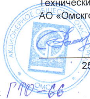
График ГТО-66 к договору 08р/2-153 от 22.11.2013 на 2021 год

выполнения работ АО «Омскгоргаз» по ТО ВДГО/ВКГО тип ВКГО: Плита бытовая