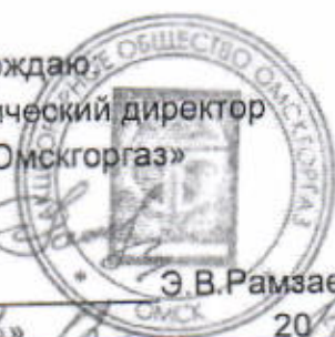
График к договору 08р/2-149 от 25.11.2013 на 2018 год

выполнения работ СВС -2 АО «Омскгоргаз» по ТО ВДГО плит бытовых