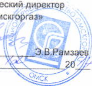
График к договору 08р/2-90 от 22.05.2017 на 2018 год выполнения работ СВС -3 АО «Омскгоргаз» по ТО ВДГО плит бытовых