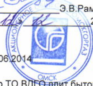
График к договору 08р/2-1611 от 02.06.2014 на 2018 год выполнения работ СВС -1 АО «Омскгоргаз» по ТО ВДГО плит бытовых