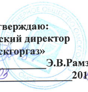
График № ГТО-5д к договору №54-ро от 01.10.2013г. на 2017г.

выполнения работ СВС-2 АО «Омскоргаз» по ТО ВДГО (ежегодное) и ПТО ВДГО (трехгодичное) на домах ООО «Сибжилсервис»