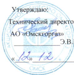
График № ПТО-996

к договору № ОСР/12-1944 от 01.05.2014 на 2017 год