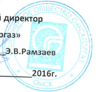
График № ПТО-1003

к договору № 08p/2-102 от 24.01.2014года