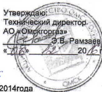
График № 1750-946 к договору № цлг08р/2-2067 от 01.07.2014года

выполнения работ СВС-3 АО «Омскгоргаз» по ТО ВДГО (ежегодное) и ПТО ВДГО (трехгодичное) на домах Управляющей компании ООО "Содружество"