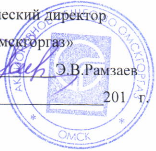
График выполнения работ СВС-2 АО «Омскгаз» по ТО ВДГО (ежегодное) и ПТО ВДГО (трехгодичное) на основании договора с собственниками жилья на 2016 год