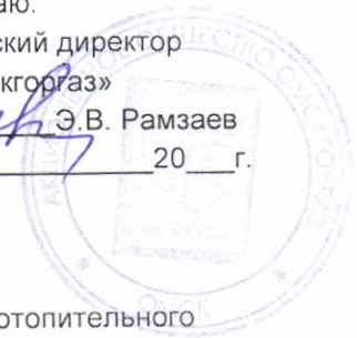
График выполнения работ СВС-3 АО «Омскгаз» по обслуживанию газового отопительного оборудования (газовых котлов)