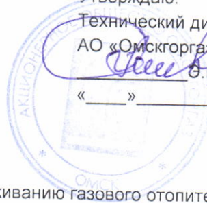
График выполнения работ СВС-3 АО «Омскгоргаз» по обслуживанию газового отопительного оборудования (газовых котлов)